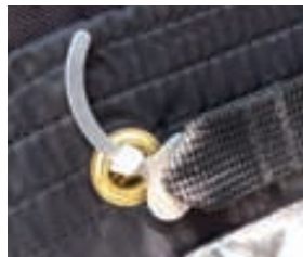
Aiguille de verrouillage

Aiguille de verrouillage Petite tige métallique assurant le maintien du parachute de secours dans sa poche de sellette et permettant son ouverture rapide. Lorsque l'on tire sur la poignée, l'aiguille sort de son logement, ce qui libère les suspentes et le pod. Le contrôle de la bonne position de l'aiguille ou des aiguilles, généralement protégées par un rabat transparent, fait partie de la visite prévol.